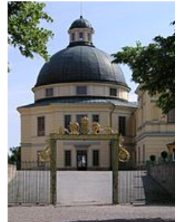
La ilesia del palaciu.

El diseñu de la ilesia del palaciu corrió al cargu de Nicodemus Tessin, y sería completáu pol so fíu Nicodemus Tessin el Mozu en mayu de 1746. Esiste nel so interior un órganu de 1730 entá en funcionamientu. Destaquen tamién los tapices de tiempos de Gustavo V. Na actualidá ye utilizada pola xente del conceyu de Lovön, quien alleguen al cultu l'últimu domingu de cada mes.